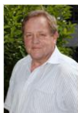
H. Schnüttgen Haustechnik